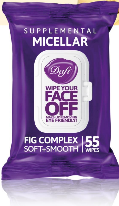
FIG COMPLEX SOFT+SMOOTH

* دستمال مرطوب پاککننده آرایش میسلار دربدار دافی: